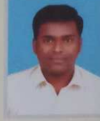
बुचडे ऑंकार कुमार बी.बी.ए. - ३