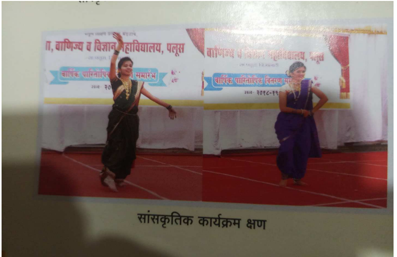
सांस्कृतिक कार्यक्रम क्षण