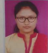
कु. डुबल सुविधा शिवाजी बी. सी. एस्स. - ३