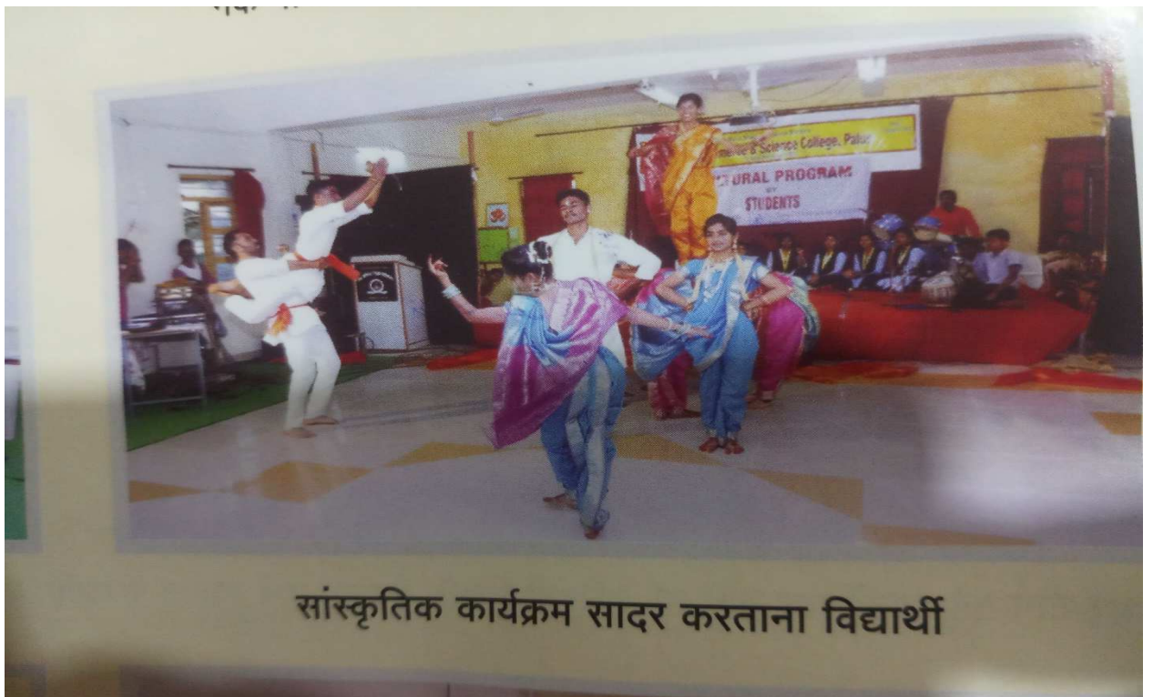
सांस्कृतिक कार्यक्रम सादर करताना विद्यार्थी