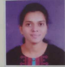
कु. माने निलम अविष्कार संशोधन स्पर्धा मेडीसीन व फार्मसी विभागात सांगली जिल्हात प्रथम