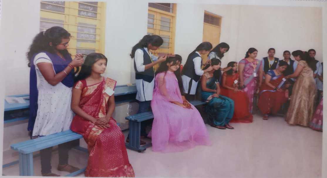
Hair style competition