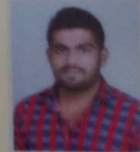
डाले सम्राट जयवंत बी. ए. - १ शि. वि. सांगली झोमल स्पर्धा - प्रथम क्रमांक कुस्ती