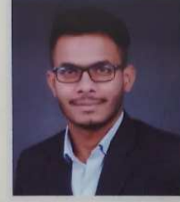
मुलाणी सोहल अविष्कार संशोधन स्पर्धा शिवाजी विद्यापीठात अॅग्रीकल्चर अॅण्ड अॅनिलम हॅजबडरी विभागात प्रथम