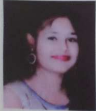
पटेल पूजा विनोद शिवाजी विद्यापीठ गुणवत्ता शिष्यवृत्ती