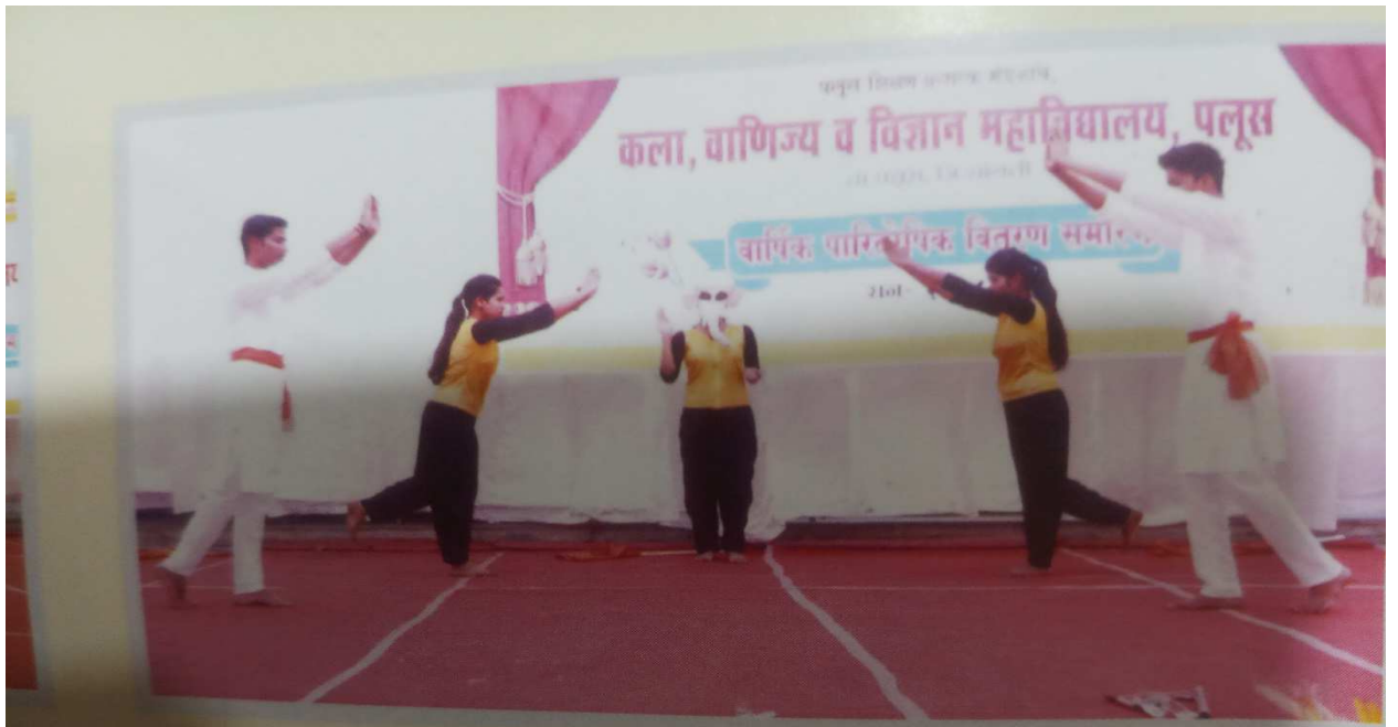
सांस्कृतिक कार्यक्रम क्षण