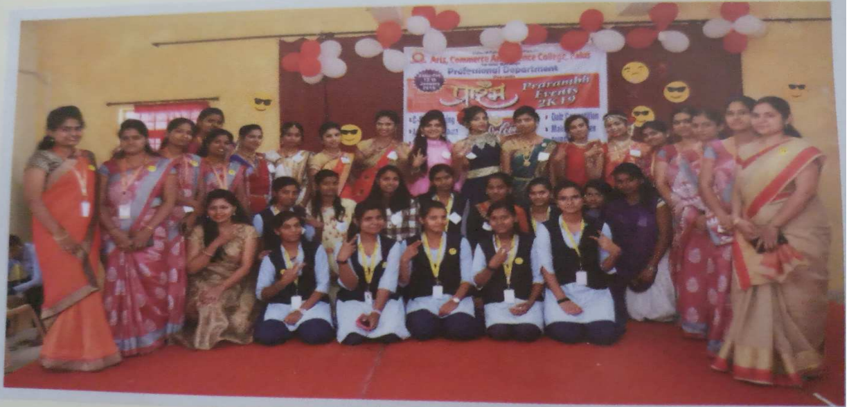
प्रारंभ उद्घाटन प्रसंगी उपस्थित विद्यार्थी व शिक्षक वर्ग

कला, वाणिज्य व विज्ञान महाविद्यालय, पलूस